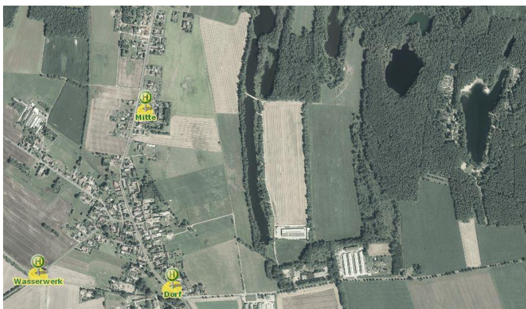
Abb. 1: Bushaltestellen in der Umgebung des Plangebietes.

Eine direkte Anbindung an den öffentlichen Personennahverkehr (ÖPNV) gibt es nicht. Die nächsten Bushaltestellen befinden sich in Groß Düben (HP Mitte, HP Dorf, HP Wasserwerk) – sind aber für eine fußläufige Anbindung zu weit weg von dem Waldsee entfernt.